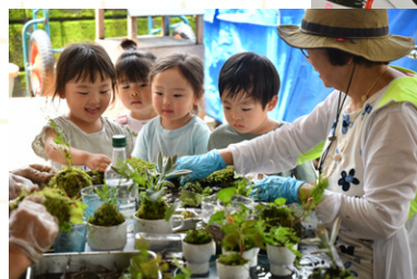
多世代参画のボランティアさん