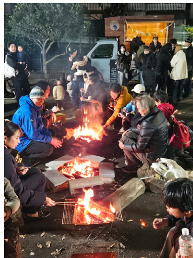
冬至に行う「ぼ～燃会」