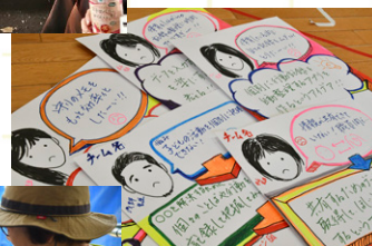
保育園主催アイデアソン