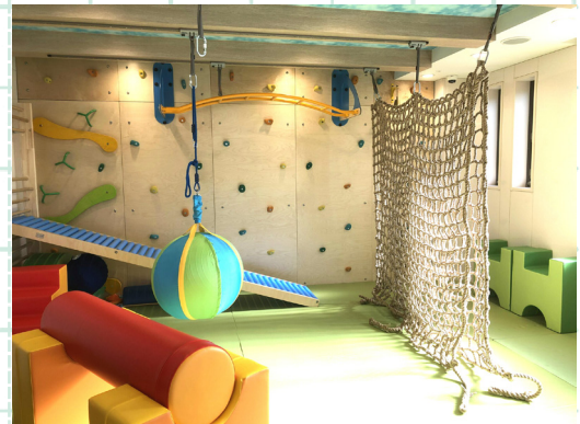
「発達の気になる子のためのプレイルーム」 小さなスペースで、さまざまな「動き」ができるようにレイアウトしている

【主催】 一般社団法人 園Power http://www.en-power.org/ 【お問合せ】 enpower.org@gmail.com 【協力】 合同会社 MichiLab