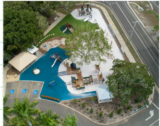
「バンダバーグボタニック植物園の遊び場」 オーストラリアのベストプレイスペースを受賞したHAGS社のインクルーシブ公園

大学で社会福祉を学び、国立総合児童センター「こどもの城」で17年間勤務。閉館後、学童保育指導員/保育士を経て、幼児教育環境作りに携わりたい思いで株式会社アネビーに入社。現在は、発達障がい児にむけた遊び環境を、専門施設はもちろん、幼稚園/保育園/認定こども園に提案している。